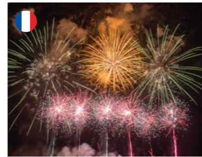
Feux d'artifice 14 juillet / Stade Gaston Godail • 15 août / Port July 14th / Gaston Godail Stadium • August 15th / Port