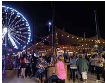
Monsieur Arthur Juillet > août / Quai Arthur Rimbaud July > August / Quai Arthur Rimbaud