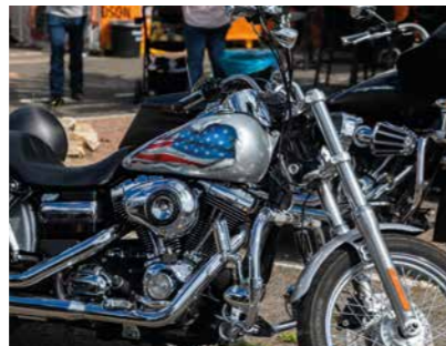
Late summer days 26 > 28 septembre / Port September 26th > 28th / Port