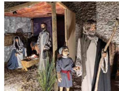
Crèches du monde Décembre > janvier / Village December > January / Village