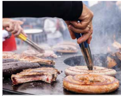
Le cochon toqué 3 > 4 mai / Port May 3th > 4th / Port