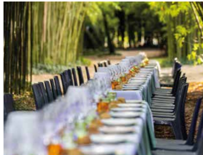
Les épicuriens Juillet > août / Lagune • Jardin des plantes July > August / Lagune • Plant garden