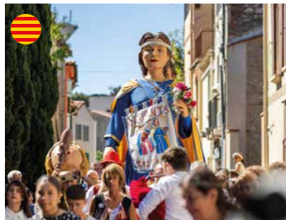
Festa Major 12 > 14 septembre / Village September 12th > 14th / Village