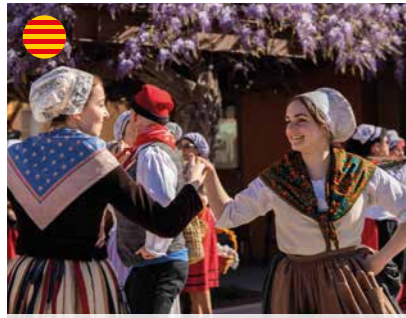
Fêtes Pascales 19 > 21 avril / Village April 19th > 21th / Village