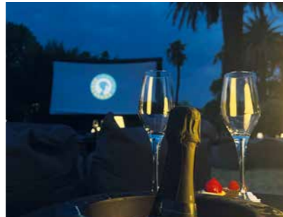
Les nuits du 7 e art Juillet > août / Jardin des plantes July > August / Plant garden