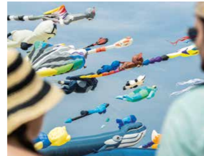
Festival du cerf-volant 23 > 24 août / Plage Nord August 23th > 24th / North Beach