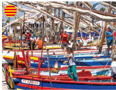
Fête de la Saint-Pierre 27 > 29 juin / Port June 27th > 29th / Port