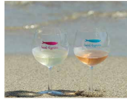
Osé, le rosé / les bulles ! 10 > 11 mai / Place Maillol May 10th > 11th / Place Maillol